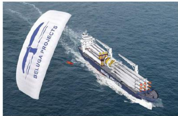
voile pour navire (8t de traction)