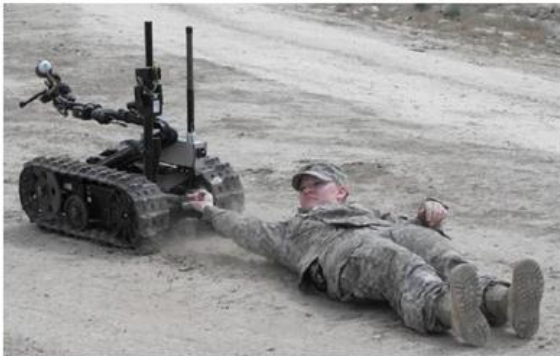
robot militaire d'extraction

Représenter les forces de traction sous la forme de vecteur (n'oubliez pas d'indiquer le nom de chaque vecteur).