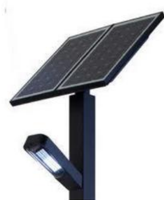
vent sur les panneaux par rapport au bas du poteau

Pour chaque photo, tracer le vecteur force, le bras de levier et le point autour duquel le moment est le plus grand