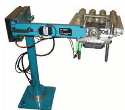
poids soulevé par rapport au mât vertical du robot