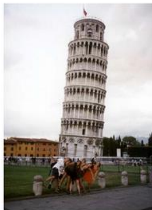
poids de la tour par rapport au sol