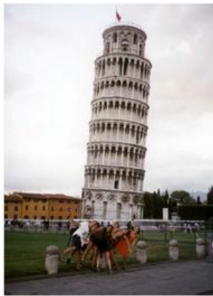
poids de la tour par rapport au sol