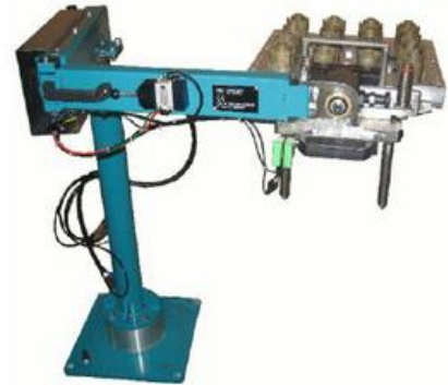
poids soulevé par rapport au mât vertical du robot