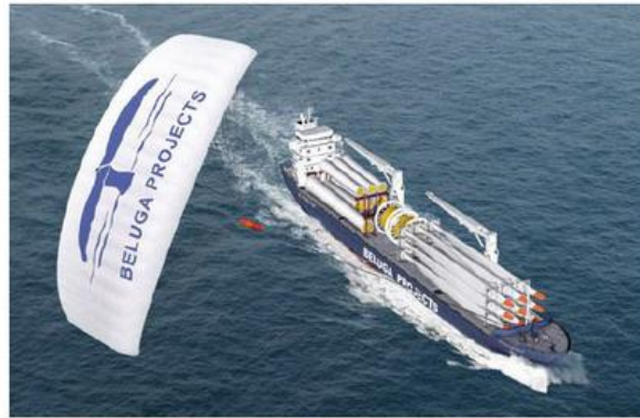
voile pour navire (8t de traction)