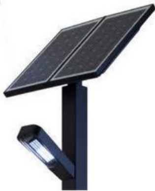
vent sur les panneaux par rapport au bas du poteau

Pour chaque photo, tracer le vecteur force, le bras de levier et le point autour duquel le moment est le plus grand